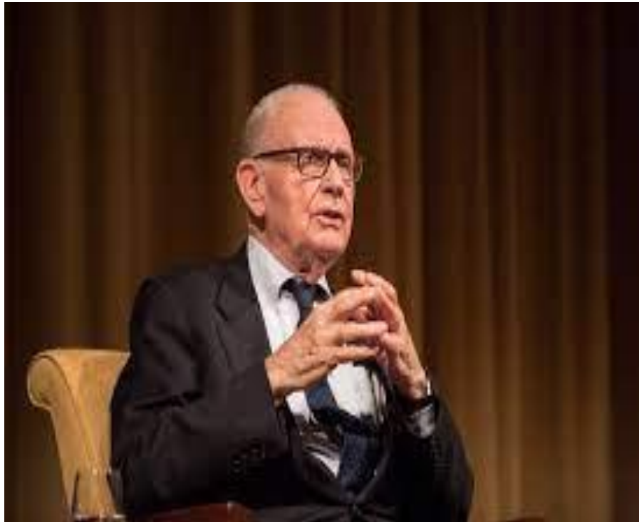
لى نىچ هاميلتون