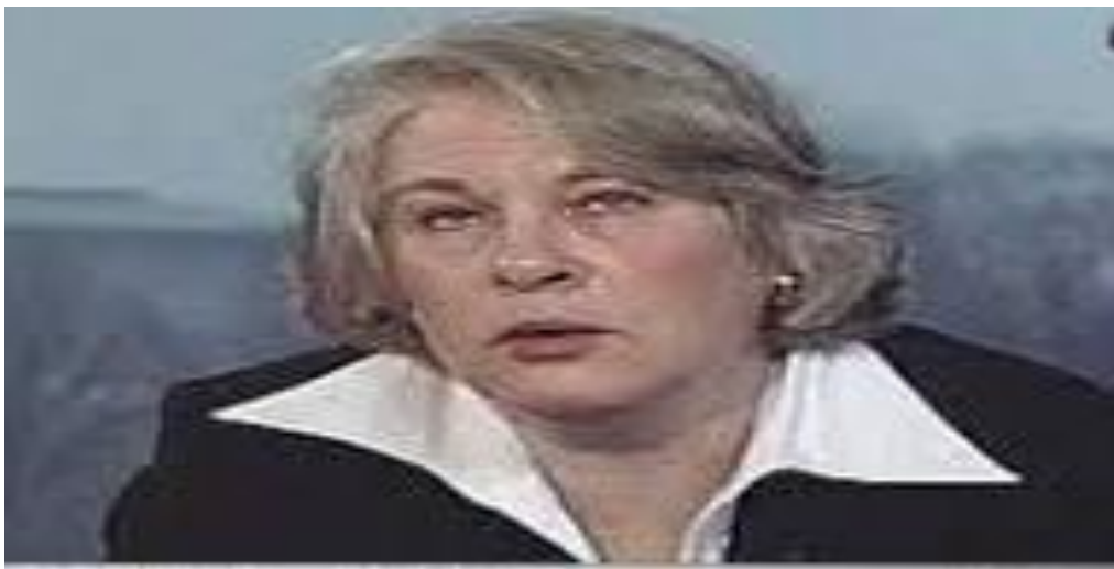
خاتوو لاورى ئان میلرۆی