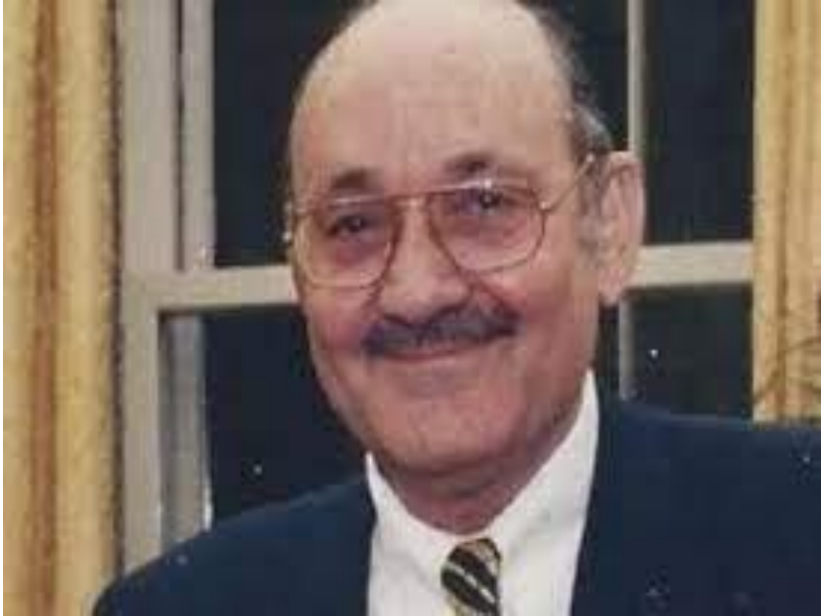
پروفیسور دکتور نامیذا بارام