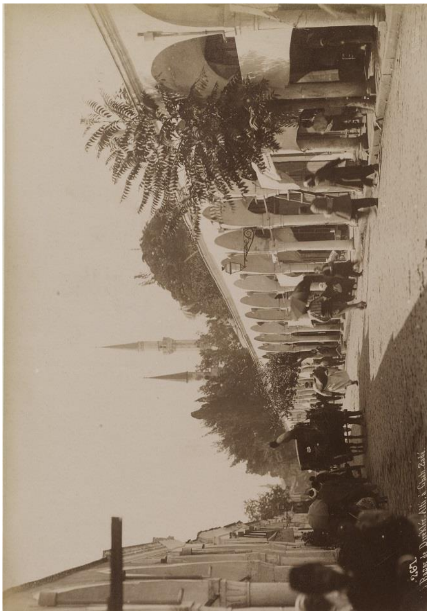
شازاده باشی له نهسته مبول