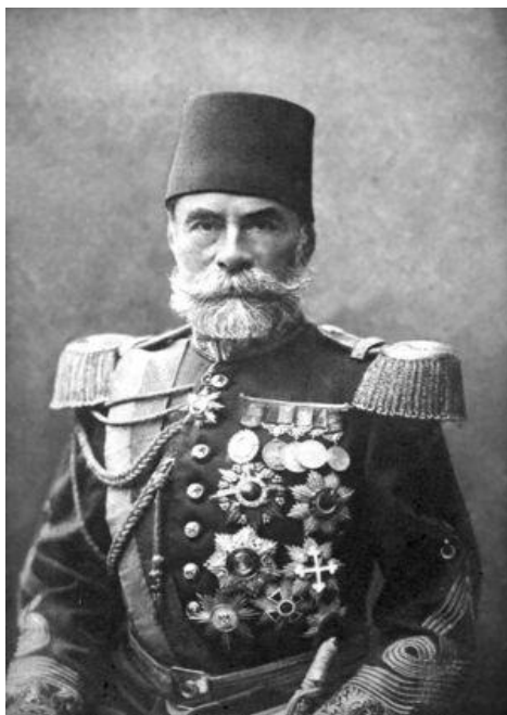
ئەحمەد موختار پاشا ۱۸۳۹-۱۹۱۹

خۇى لانادات. ئەو حوكمى (مفسدىن فى الارض) بەگوپرهى شەرعىيەتى پاكىزى ئىسلام دەرھەق بەوان پەپرهوى دەكات (ان يقتلوا او يصلبوا او ينفوا فى الارض / بكوثرين يان هەلبواسرېن يان له زهويدا دووربخرېنەوه). ھەركاتېك كەسېك بېت ئەوانە بەدكارى سەر رووى زهوى نېن، ئەوكات ئەوېش بۆخوى دەچېتە نېو دەستەى بەدكارانەوه، ئەگەر ئەوانە نووسەرى رۆژنامەكانېش بن. ھۆكارەكانى ئەوھش ئاشكرايە..."