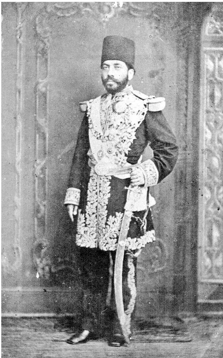
میرزا حوسین خان سوپاسالار ۱۸۲۷-۱۸۸۱