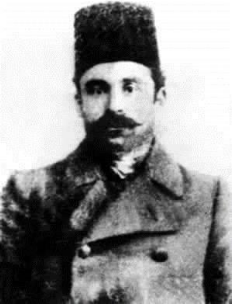
همز اغای مہنگور ؟-۱۸۸۱